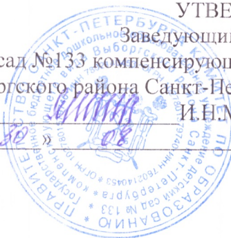
ГРАФИК ВЫДАЧИ ПИТАНИЯ