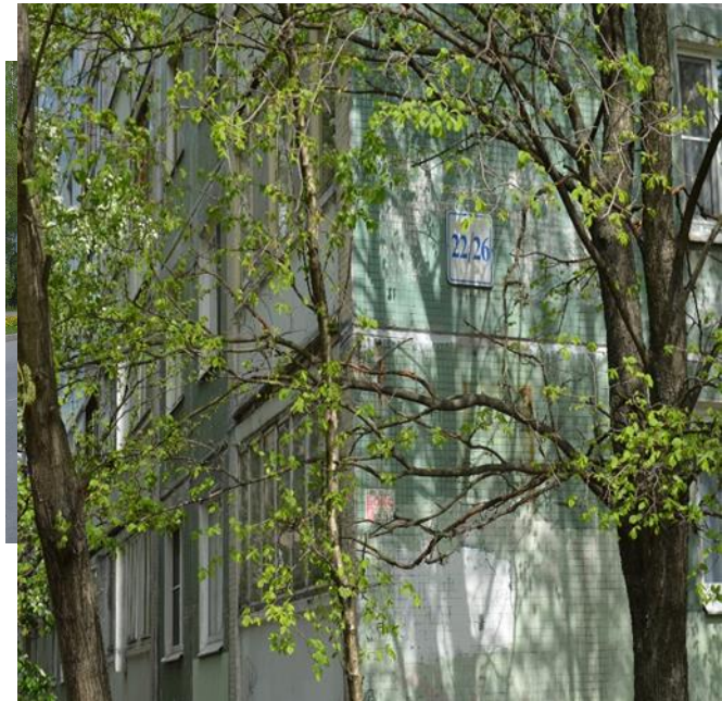
4.Номер дома по Сиреневому бульвару ,перед которым находится поворот для проезда к детскому саду.