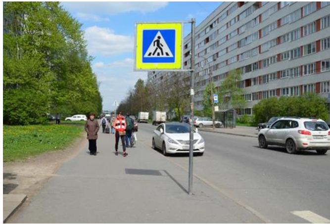
10 .Пешеходная дорожка по улице Руднева к детскому саду.