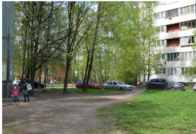
11.Продолжение пешеходной дорожки к детскому саду со стороны улицы Руднева