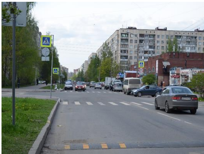
1. Перекресток ул. Кустодиева и Сиреневого бульвара (пешеходные переходы)