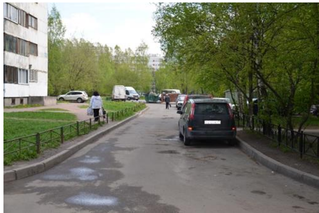
5.Продолжение дороги к детскому саду со стороны Сиреневого бульвара