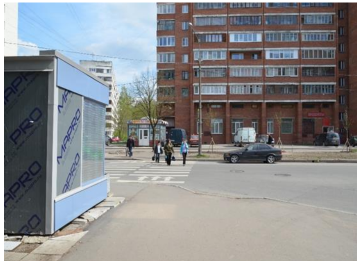
9. Пешеходный переход ул. Руднева