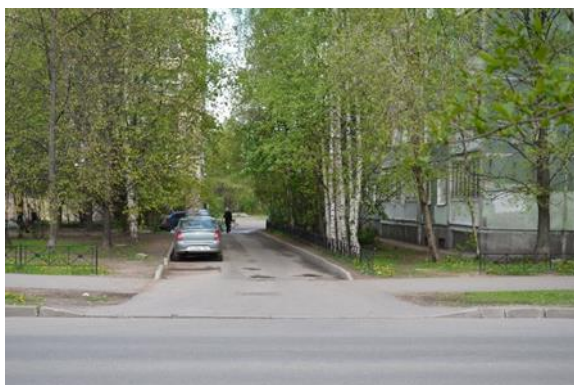
3. Поворот с сиреневого бульвара для проезда к детскому саду со сторону перекрестка ул. Кустодиева и сиреневого бульвара.