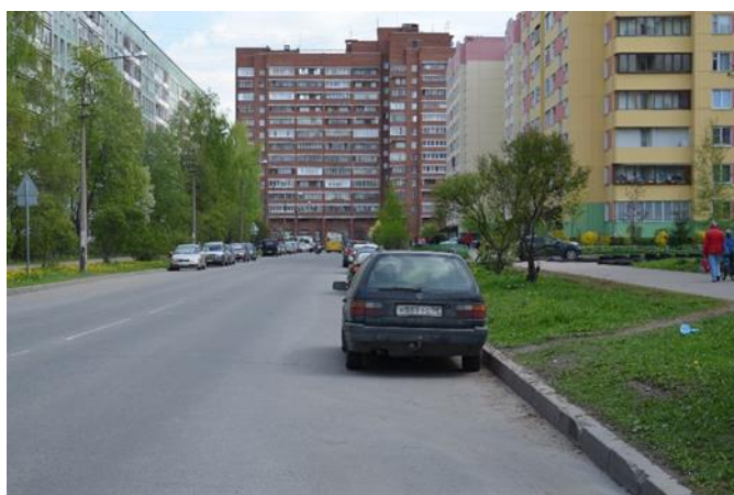
2. Сиреневый бульвар в сторону ул. Руднева