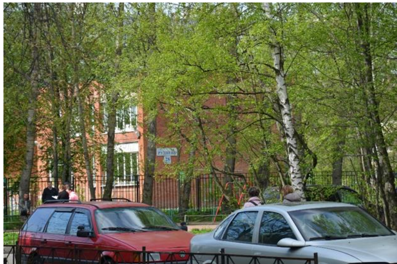
12.Продолжение пешеходной дорожки со стороны улицы Руднева.