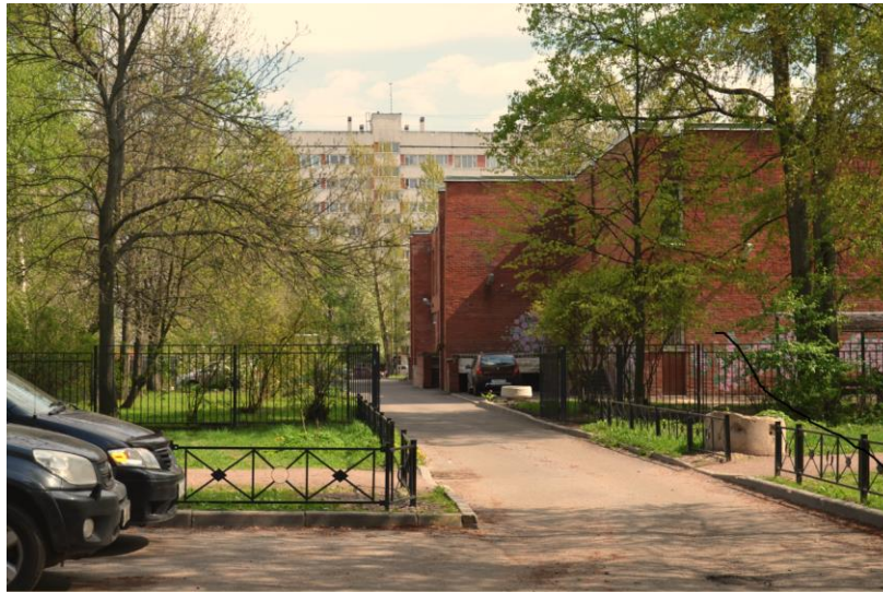
7. Въезд в детский сад со стороны Сиреневого бульвара.