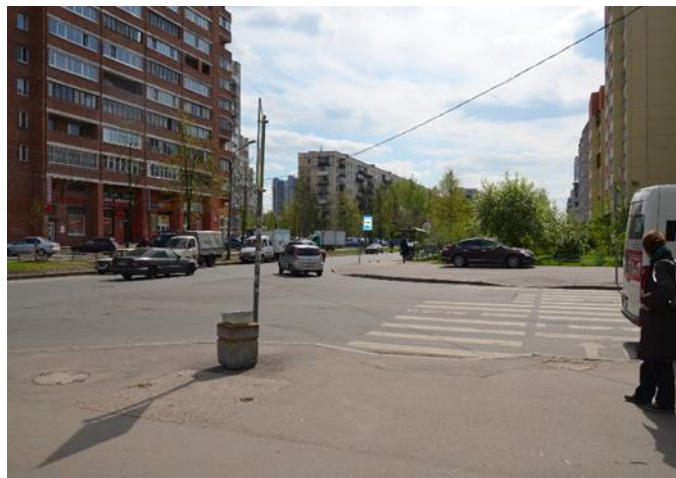
8. Перекресток Сиреневого бульвара и ул. Руднева (пешеходные переходы)