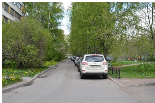
6. Продолжение дороги внутри квартала со стороны Сиреневого бульвара к детскому саду.